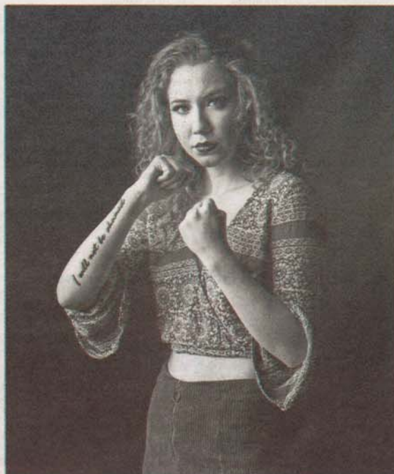
'I will not be shamed'.