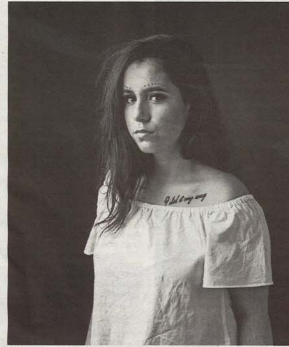
'I did it my way'.